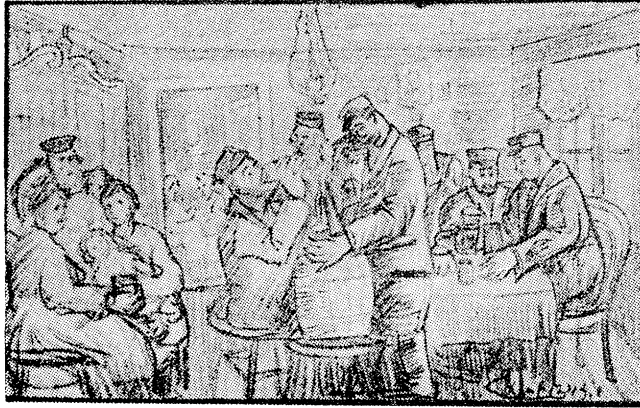
בערטשע פלומפט און טיילט ביר... 2טער טייל, ז' 150